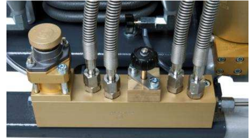
Umschalteinrichtung für MARINER 320

Bei Anlagen mit Umschalteinrichtung können Flaschen mit Fülldruck 200 bar von einer Anlage mit PN 300 gefüllt werden. Durch Öffnen des Umschaltventils wird das Sicherheitsventil 225 bar und die Fülleinrichtung PN 200 bar zugeschaltet und die angeschlossenen Flaschen können sicher gefüllt werden.