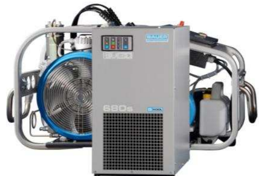
B-KOOL stand-alone vor MARINER

Die im Kompressor verdichtete heiße, gesättigte Luft wird im B-KOOL auf ca. +3 °C gekühlt. Dadurch wird im Endabscheider eine wesentlich größere Menge an Kondensat abgeschieden. Dies erhöht die Standzeiten der nachfolgenden Filterpatronen. Abhängig von der Umgebungstemperatur kann die Standzeit der Filterpatronen bis zu 11fach verlängert werden. Je höher die Umgebungstemperatur, umso mehr verlängert sich die Filterpatronen-Standzeit.