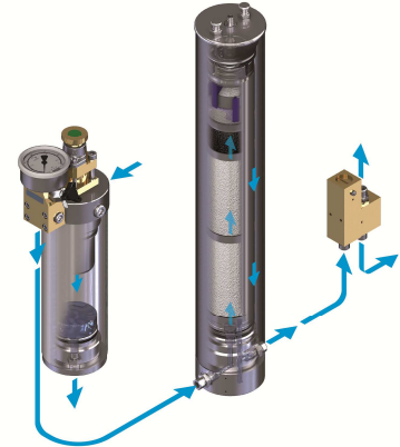
Filtersystem P41/350 (Abbildung ähnlich)