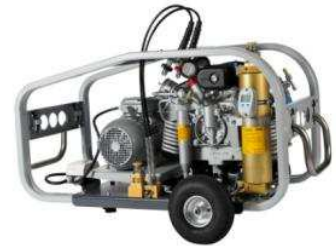
MARINER-E mit Fahrsatz

Er dient zum einfachen und kraftsparenden Transport mobiler Kompressoranlagen. Mit Lufträdern ausgestattet, ermöglicht er größtmögliche Mobilität. Komplett mit 1 Achse, 2 Rädern und Deichsel am Kompressorrahmen montiert.