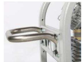
Sturzrahmen inkl. Tragegriffe

Der korrosionsbeständige Sturzrahmen bietet zusätzlichen Schutz für die Anlage und erlaubt zusätzliche Anbauten, z. B. einer Kompressorsteuerung oder eines größeren Filtersystems. Die Tragegriffe ermöglichen einfachen und komfortablen Transport.